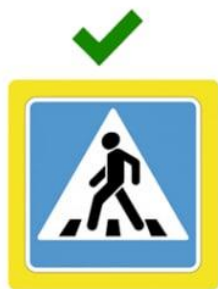
Наземный пешеходный переход

Он обозначен дорожными знаками «Пешеходный переход» и белыми линиями разметки «зебра».