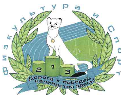
ГРАФИК ПРИЁМА ИСПЫТАНИЙ ВФСК «ГТО»